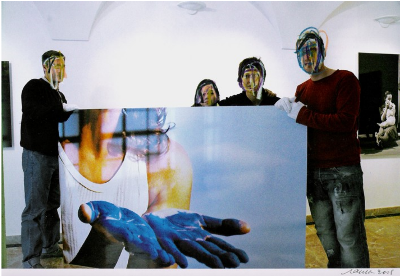
Sin titulo, 2005. Técnica mixta sobre fotografía, 28 x 42 cm.