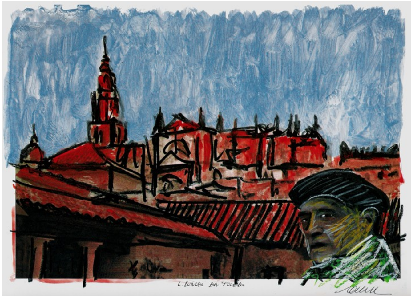
Sin título, técnica mixta sobre fotografía, 28 x 42 cm.