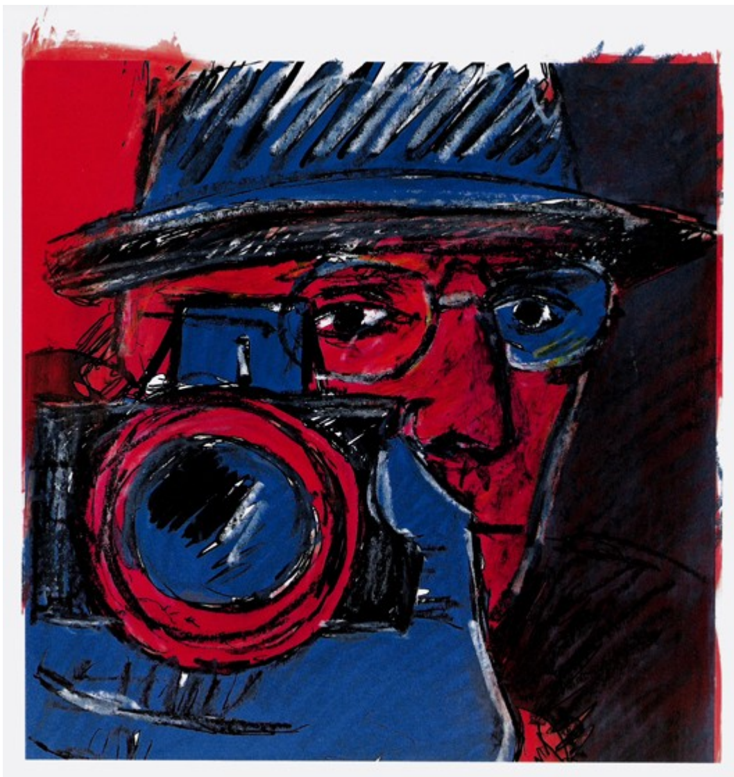
Sin título. Técnica mixta sobre fotografía 42 x 28 cm.